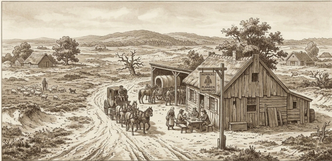
DE EERSTE HERBERG, HET PLANKEN WAMBUIS, OP DE HOGE VELUWE, ONTSTAAN IN DE 18 e EEUW

Hij heeft gelijk. De naam is een kleine poëzie van overleving: een planken wambuis. Een beschermend jasje in een landschap dat geen genade kent.